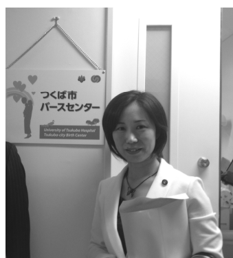
つくば市バースセンター評価委員の 任をいただきました。 開設説明会に出席（25.9.26）